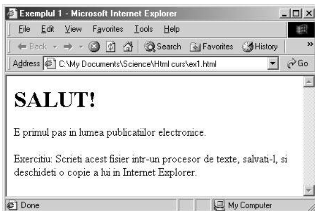
Fig. 1 Exemplul 1.1 vizualizat în Internet Explorer

<body> <H1> SALUT! </H1> <P> E primul pas în lumea publicațiilor electronice. </P> <P> <B> Exercițiu </B> Scrieți acest fișier într-un procesor de texte, salvați-l, și deschideți o copie a lui în Internet Explorer. </P> </body> </html>